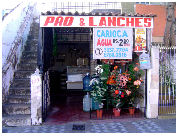
Imagem 05: Bodega do bairro